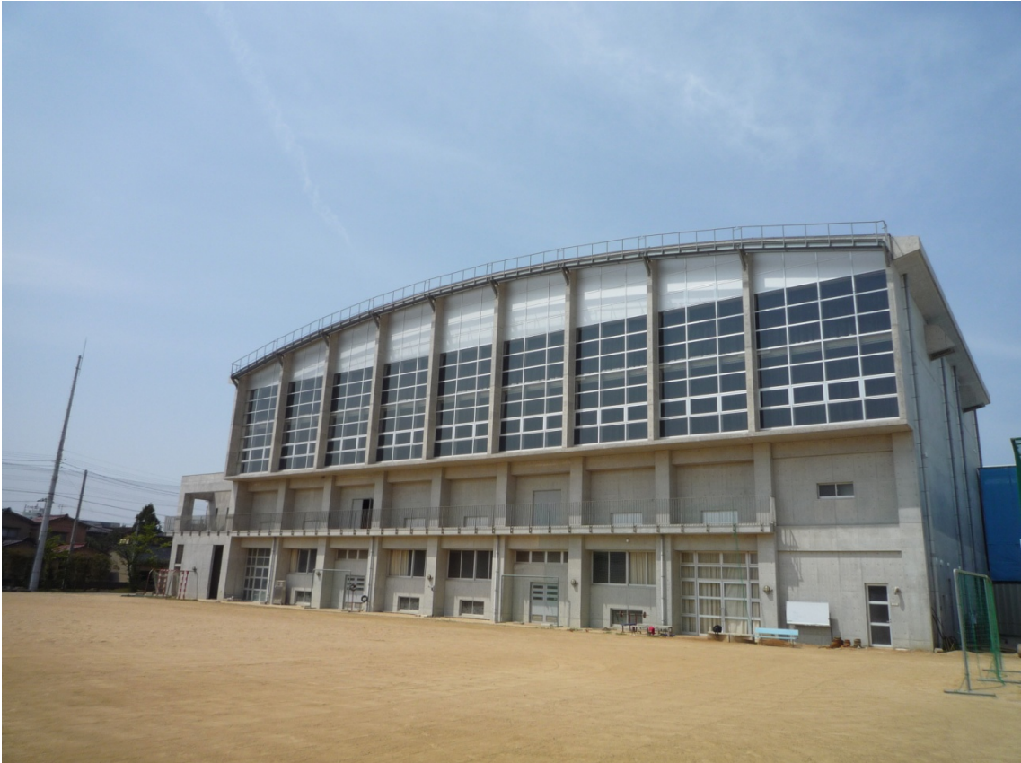
新 体 育 館