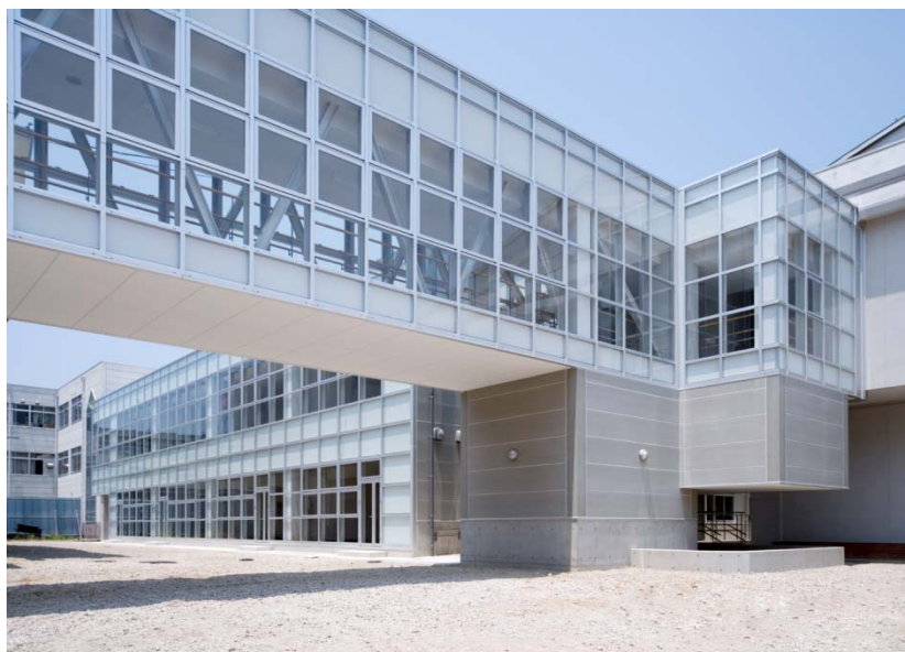
新実習棟（G棟）完成写真

平成21年9月からは、管理・教室棟の解体工事を行います。その後、管理・教室棟（A棟とB棟）の建設工事に着手いたします。工事期間中、騒音や工事車両の出入り等、大変ご迷惑をおかけしますが、ご協力の程、よろしく申し上げます。